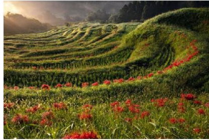
2021 優秀1「朝日射す棚田」斉藤一彦